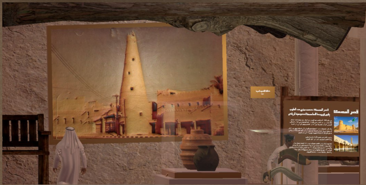
سياح داخل المعرض ، صورة تراثية ، اثار