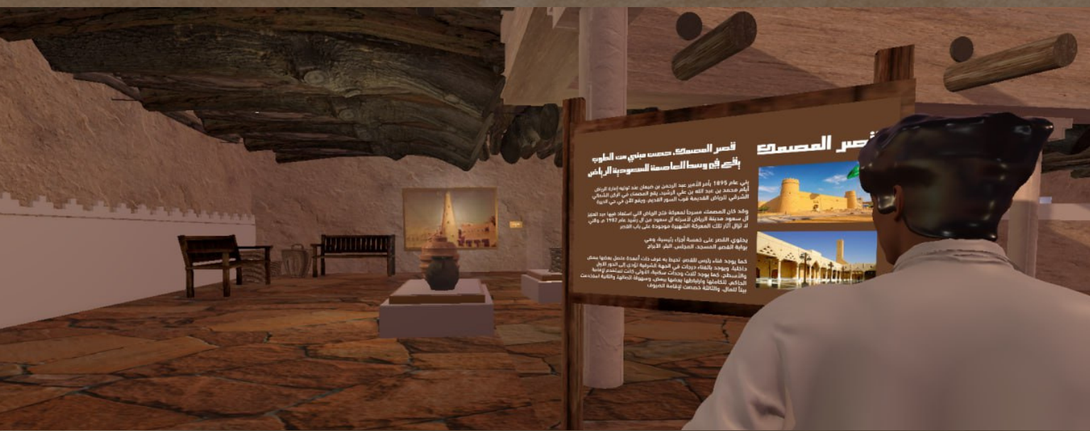
لوحة تثقيفيه عن قصر المصمك